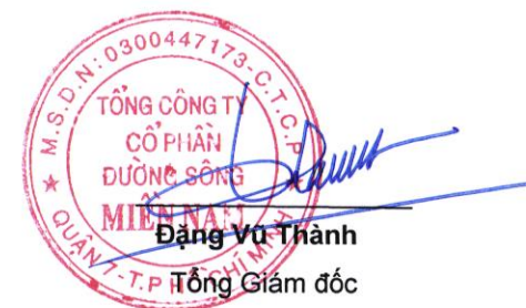
Đặng Vũ Thành