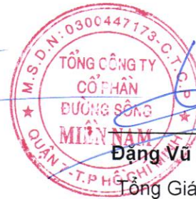
Đặng Vũ Thành